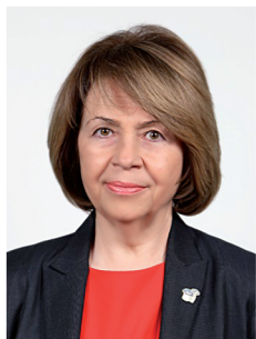
ДЕКАН ФАКУЛЬТЕТА доктор философских наук, доцент